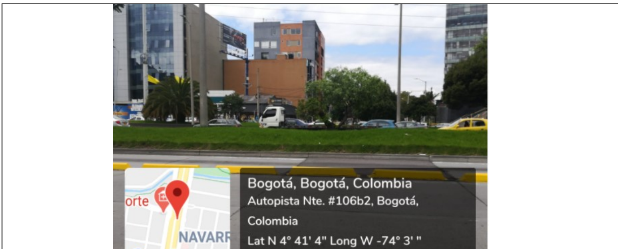
Foto 1. Vista panorámica del predio y de la valla ubicada en la Calle 108 N° 45 - 27 orientación Sur - Norte